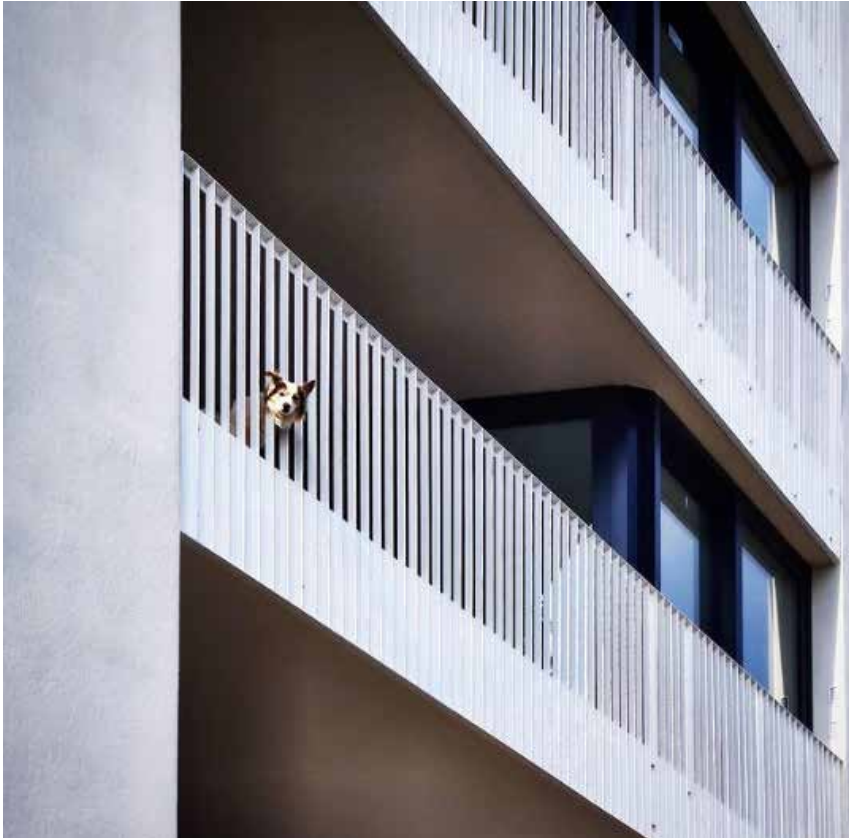
Palazzo Bracciolini, Padova 2021.